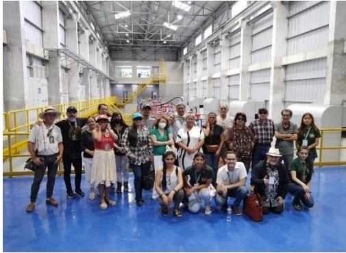
Poesía de la Selva