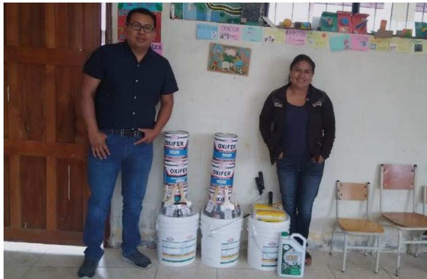
Esc. Mariscal Sucre