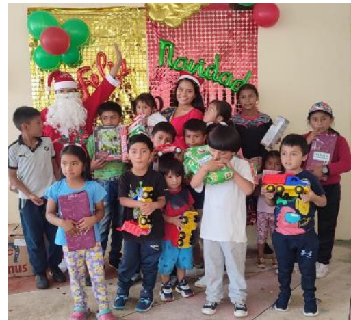
Alshi 9 de Octubre

En la parroquia Zuñac con el aporte del Gobierno Parroquial, se realiza el almuerzo comunitario, se entrega dos cerdos hornados.