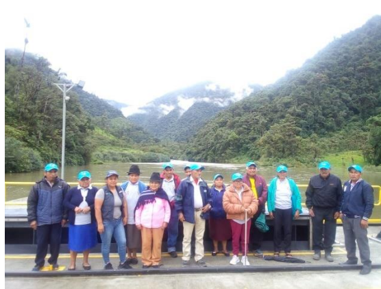
Adulto mayor de Zuñac