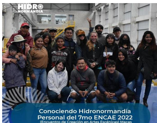
Actores ENCAE 2022

Hidronormandía fiel a su política de puertas abiertas, recibió con mucho agrado la visita de los grupos: actores culturales del séptimo ENCAE 2022, actores culturales "Poesía de la Selva", policías municipales del cantón Morona, estudiantes del Colegio Logroño, adultos mayores de Macas, adultos mayores de Zuñac, Asociación productiva Shuar para conocer nuestras instalaciones y el proceso de producción de energía limpia, la actividad nos permite dinamizar la economía local mediante la preparación de alimentos por parte de proveedores de la parroquia, compra de productos de la zona, de bebidas y snacks en las tiendas de la localidad.