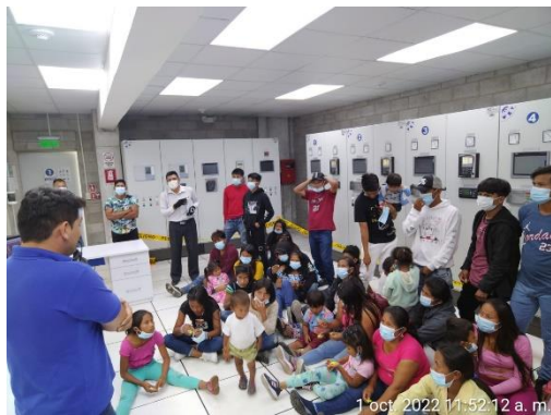
Asociación productiva Shuar