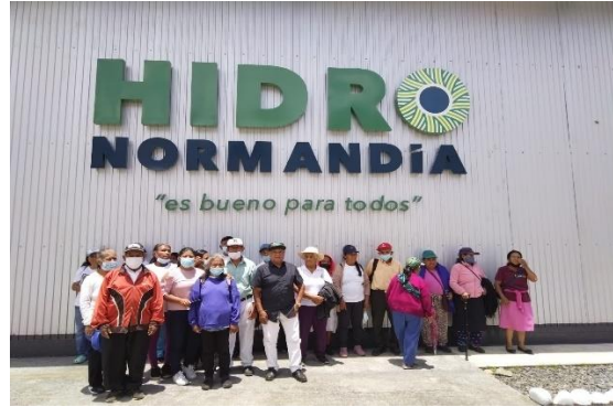
Adultos mayores Macas