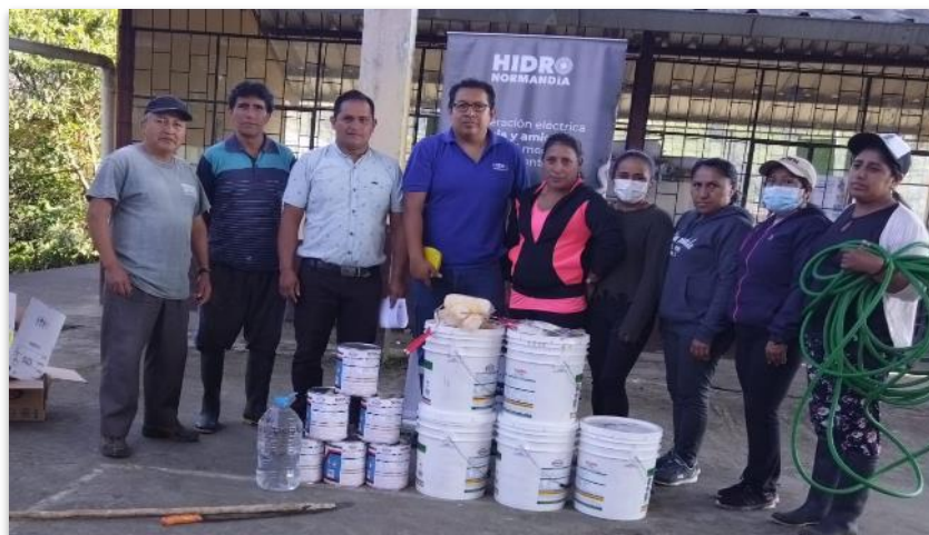
Esc. Pedro Vicente Maldonado

Para el mantenimiento de las instalaciones se entrega todo el material necesario y con el apoyo de las instituciones de las parroquias como Gobiernos Parroquiales, Tenencia Política, Policía Nacional y padres de familia se realizan los trabajos.