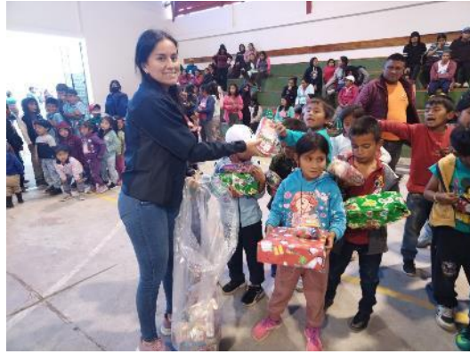
San Vicente de Zuñac